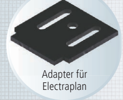
Adapter für Electraplan